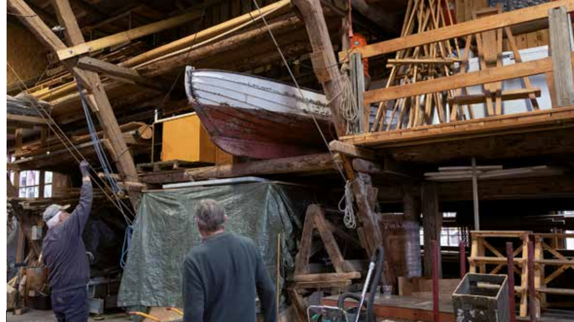
Da den gamle jolle kom op og hænge