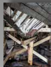
Forsiden: Kølen på Skum skal fornyes