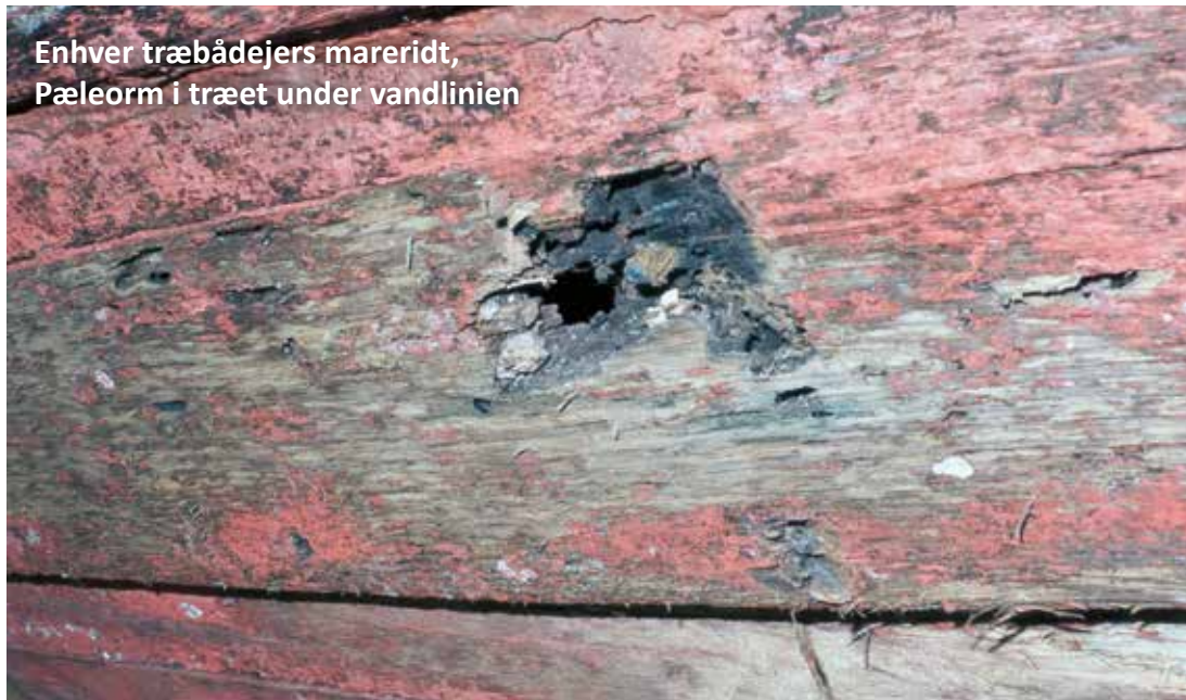
Enhver træbådejers mareridt, Pæleorm i træet under vandlinjen