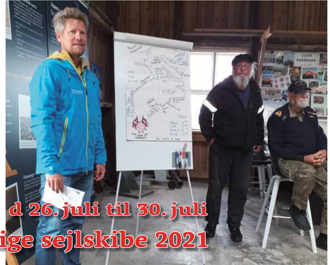
Skippermøde i Assens