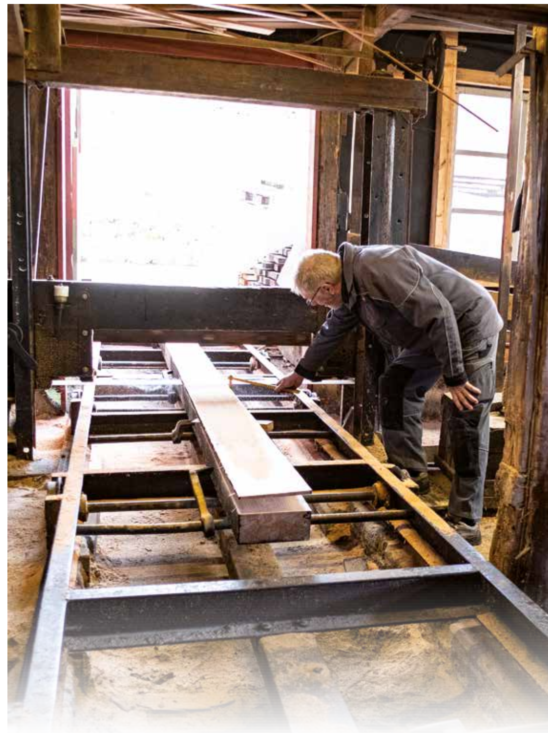
Bent skærer træstamme op på bloksaven