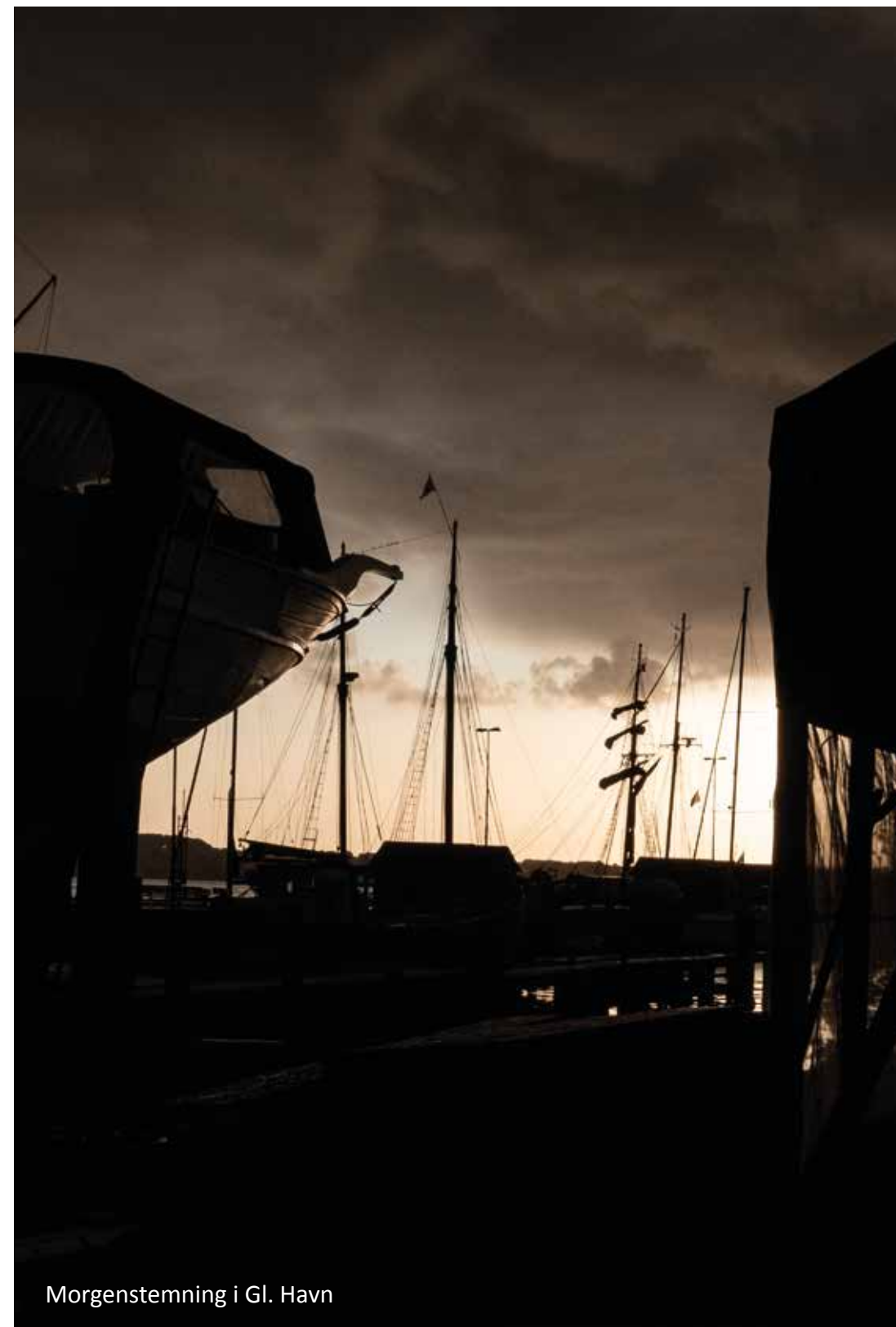
Morgenstemning i Gl. Havn