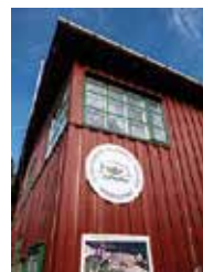
Forsiden: Nymalede bygninger og nyt logo