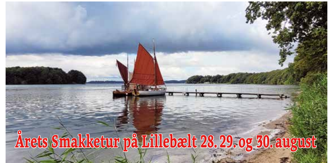
Årets Smakketur på Lillebælt 28. 29. og 30. august