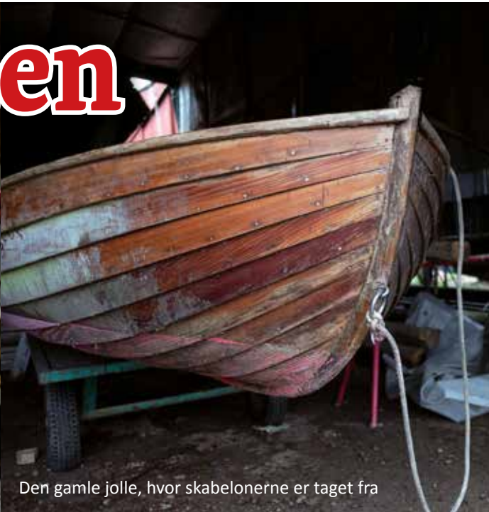
Den gamle jolle, hvor skabelonerne er taget fra