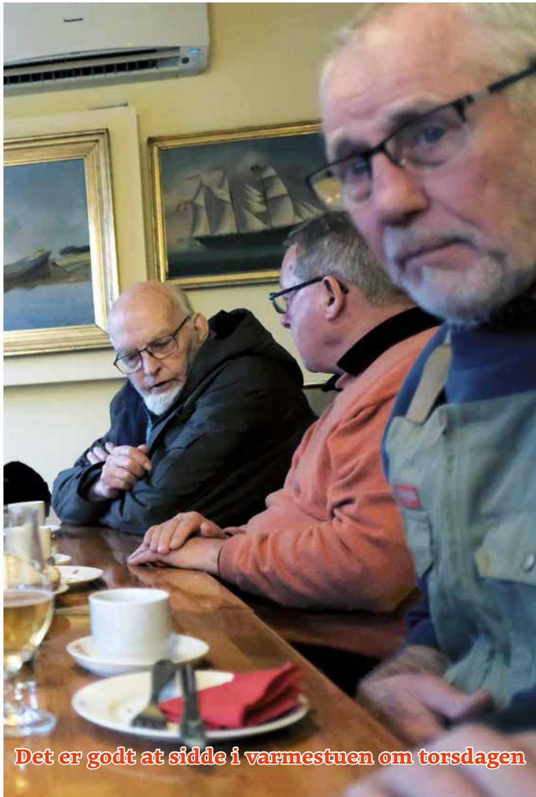
Det er godt at sidde i varmestuen om torsdagen